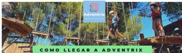
COMO LLEGAR A ADVENTRIX

Para facilitar la llegada y el aparcamiento, rogamos a los padres y madres que intenten organizarse para acceder al parque con el menor número de coches posible. Recordamos que para acceder a Adventrix hay que hacerlo desde la carretera de circunvalación (el valle), pues a menudo las indicaciones en Google Maps nos indican el acceso desde Cobisa por una carretera que NO ES TRANSITABLE . En el caso de venir desde el sur de Toledo, hay que bajar por el Parador hasta la ronda del Valle y subir por la carretera de la Pozuela ( HOTEL ABACERÍA ).